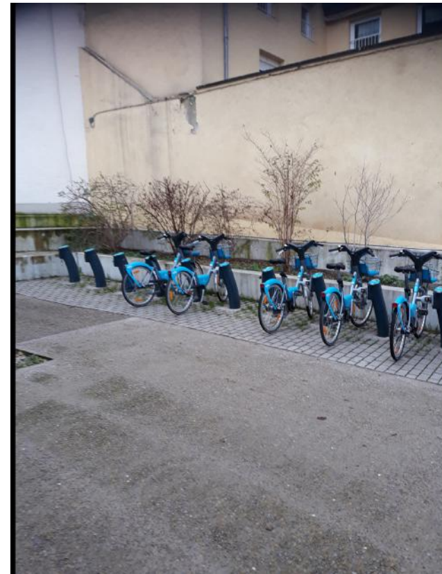
Cette photo a été prise le 13 décembre 2020 à Kirchberg .

La ville du Luxembourg met à disposition beaucoup de vélos. Cela encourage la population à faire plus d'exercices et à mieux respecter l'environnement.