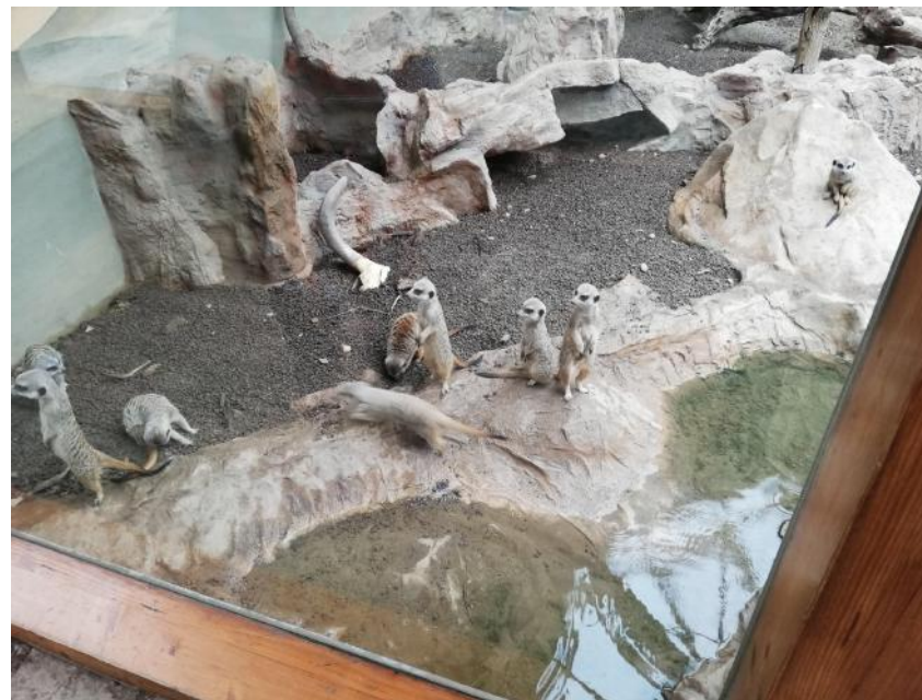
Photo de suricates prise le 15 juillet 2019 au parc merveilleux .

Le parc merveilleux est un parc de loisirs et zoologique se situant à Bettembourg. Le parc nous propose environ 2000 animaux de presque 200 espèces venant des 5 continents. Il comporte des aires de jeux, un train miniature, un parcours de chevaux galopants, un minigolf ainsi qu'un mini zoo. Un espace avec des représentations de poupées animées des contes-de-fées. Le parc nous propose une navette circulant chaque 15 minutes entre la gare de Bettembourg et le parc même. Idéal pour les petits et les grands! (source: Wikipedia, site consulté le 17 décembre 2020)