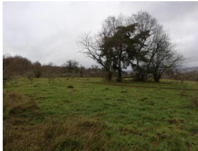
Photos prises le 12 décembre à la reserve naturelle de Dudelange

1/172ème du territoire luxembourgeois est une réserve naturelle ( 1500 ha ).