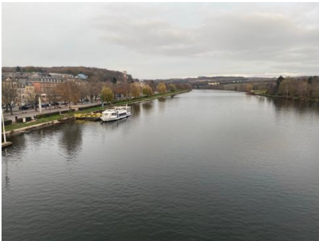
Photo prise le 10 décembre 2020 de la Moselle à Remich par Marie-Alice Arbogast.

La plus grande rivière du Luxembourg est la Moselle qui passe au sud est du pays. Ce fleuve permet de faire des traversées en bateau ou de pêcher si l'on a l'autorisation. La Moselle est également un moyen de transport pour les marchandises.