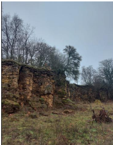
Une petit falaise à la réserve naturelle de Dudelange. Cette image a été prise le 14 décembre 2020 par Alexandre De Abreu .

Le Luxembourg a une superficie de 2500 km 2 , dont 9200 ha sont des forêts c'est-à-dire 35 % du territoire total.