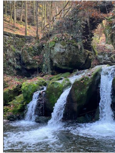
Photo des fontaines ( mini cascades ) Schiessentümpel cascade du Luxembourg le 14 novembre 2020 à Müllertall .

On compte une dizaine de réserves naturelles dans ce pays . Ceci est bénéfique pour la biodiversité luxembourgeoise. Ces réserves naturelles sont bien surveillées et propres. Les animaux des réserves sont protégés. Comme n'importe quelle réserve naturelle, il est interdit de chasser ou polluer.